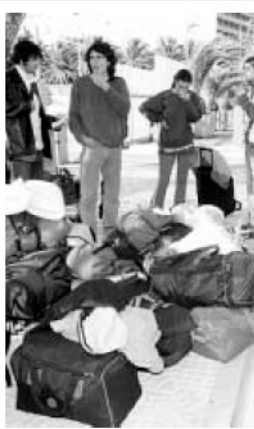
● Voluntarios de la Universidad