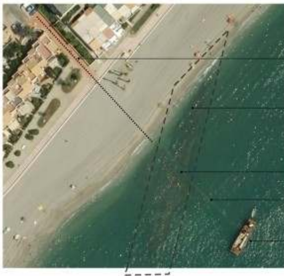
Foto aérea año 2008 Restos arqueológicos DAÑADOS